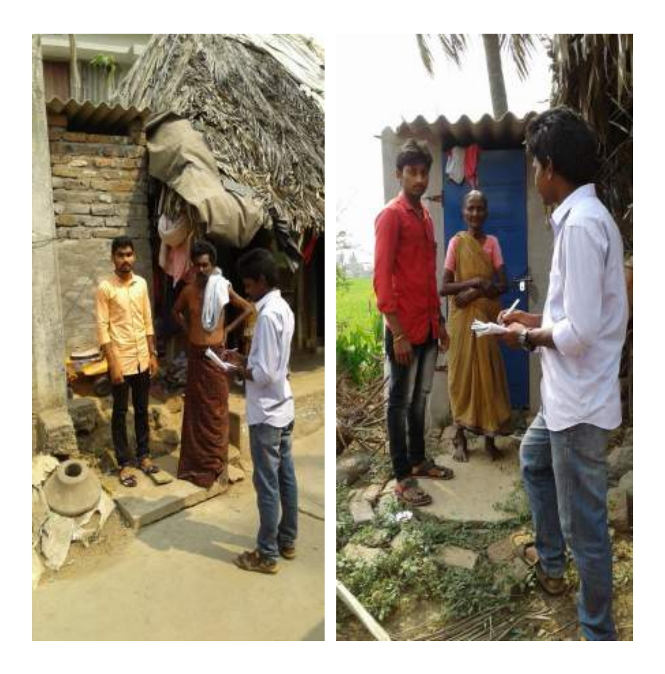
ODF Survey by NSS Volunteers