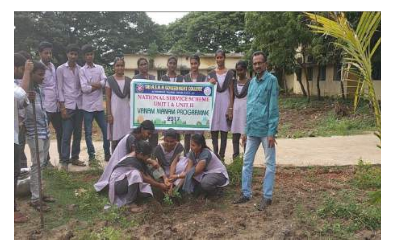
Plantation in the College Campus by Pricipal & NSS Volunteers