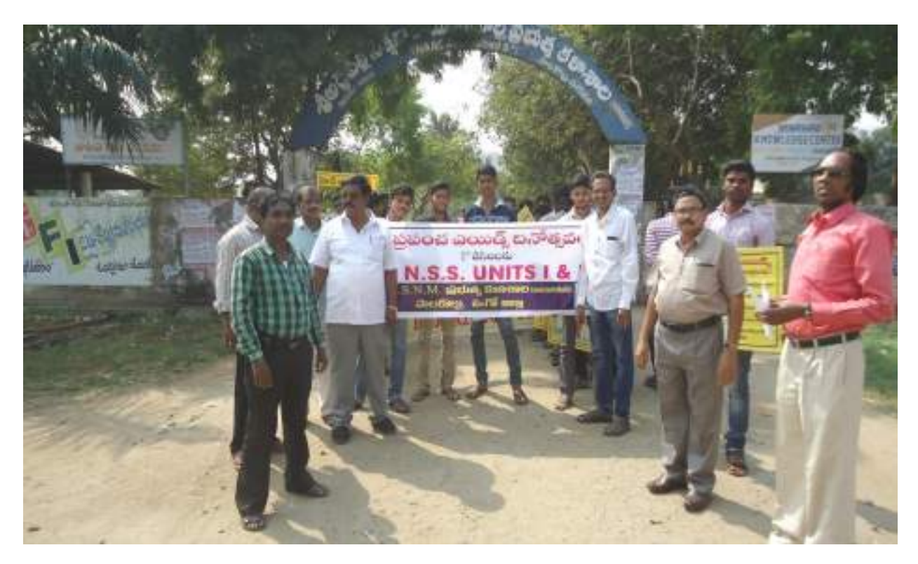
Aids Day rally started by Principal