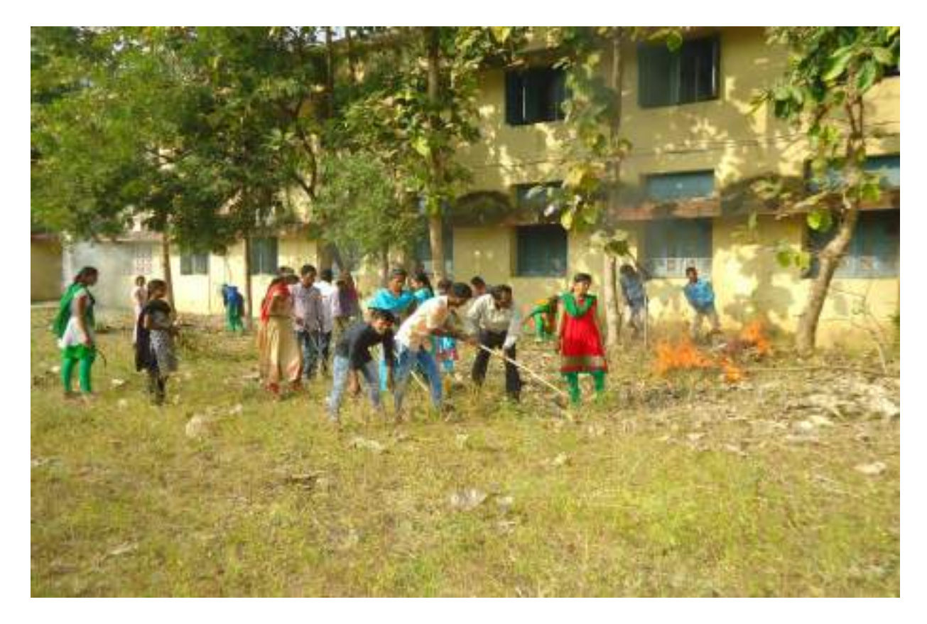
Cleaning of College Premises by NSS Volunteers