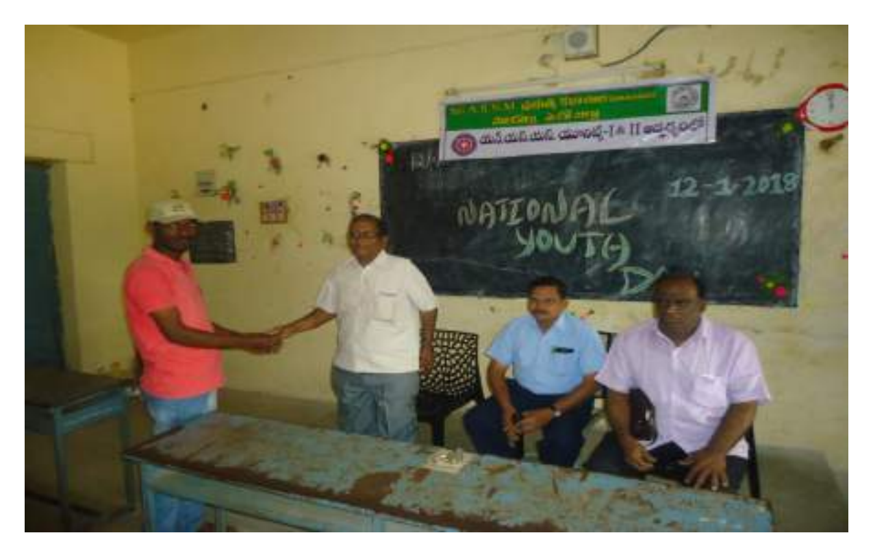
Distribution of Prizes by Resource Person to NSS Volunteer