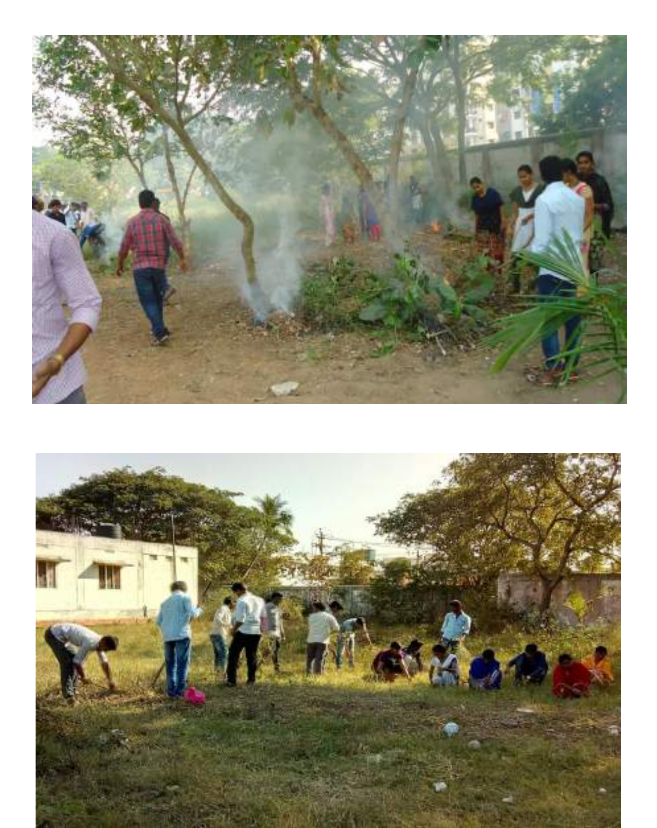
Cleaning of Hostel Premises by NSS Volunteers