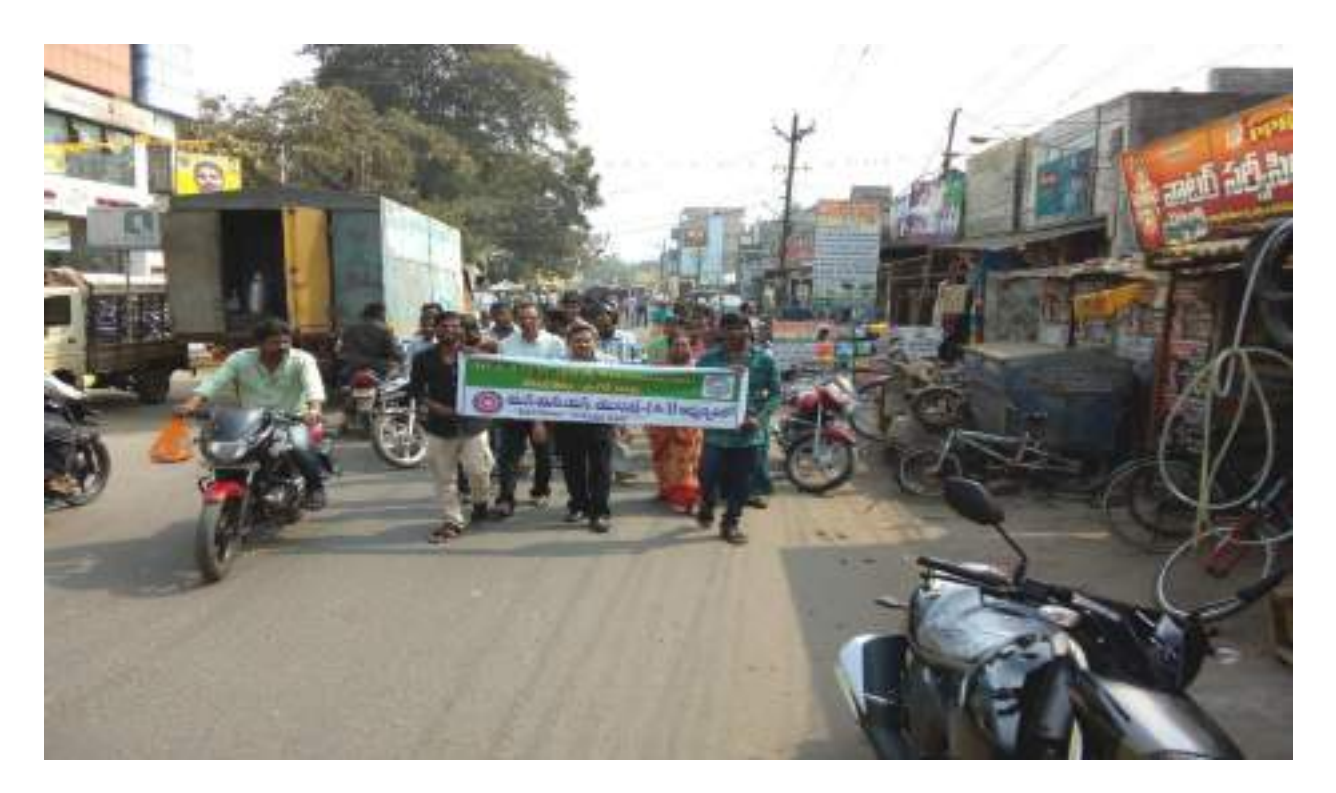
National Voters day rally by NSS Volunteers