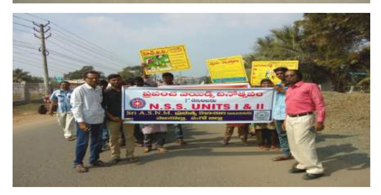
Aids Day rally by NSS Volunteers