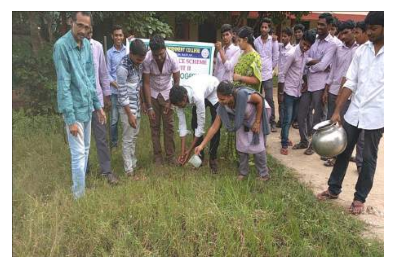
Plantation in the College Campus by NSS Volunteers